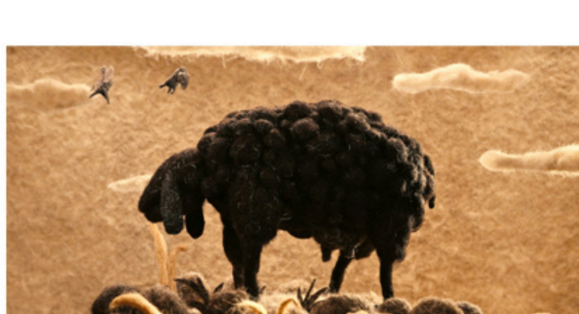
獲獎參展紀錄 2025 安錫國際動畫影展最佳委託製作影片評審團獎 2025 AICP Show 大獎得主 紐約現代藝術博物館 (MoMA) 永久收藏