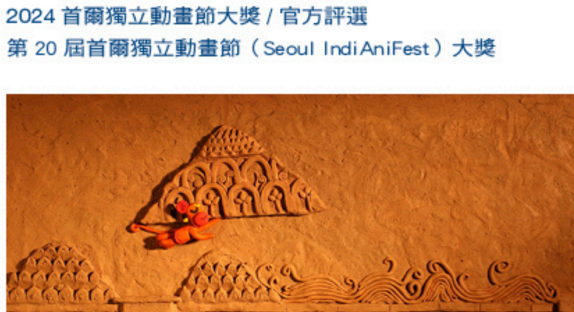
獲獎參展紀錄 2024 印度 ASIFA 卓越獎最佳導演獎 2025 印度 WAVES 卓越獎銀獎